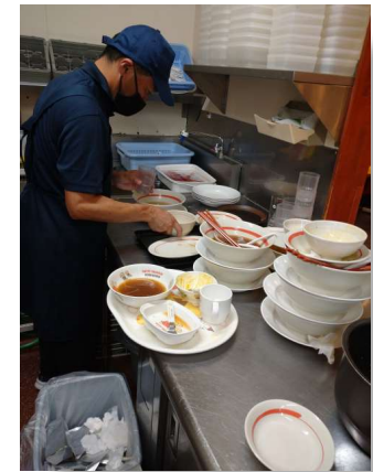
就労移行支援 実習作業風景

[城西事業所] 住所 : 山形県米沢市城西4丁目5-87 電話 : (0238)40-1391 FAX : (0238)40-1392