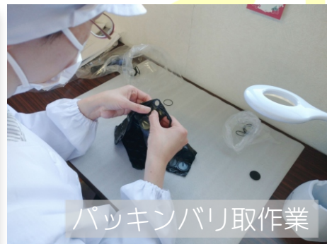
パッキンバリ取作業