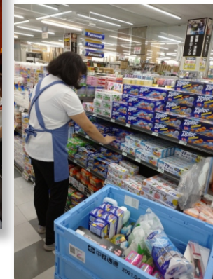
就労移行支援 実習作業風景

(※)障がい者職業センターを利用する場合は、事前にハローワークへ相談が必要です。